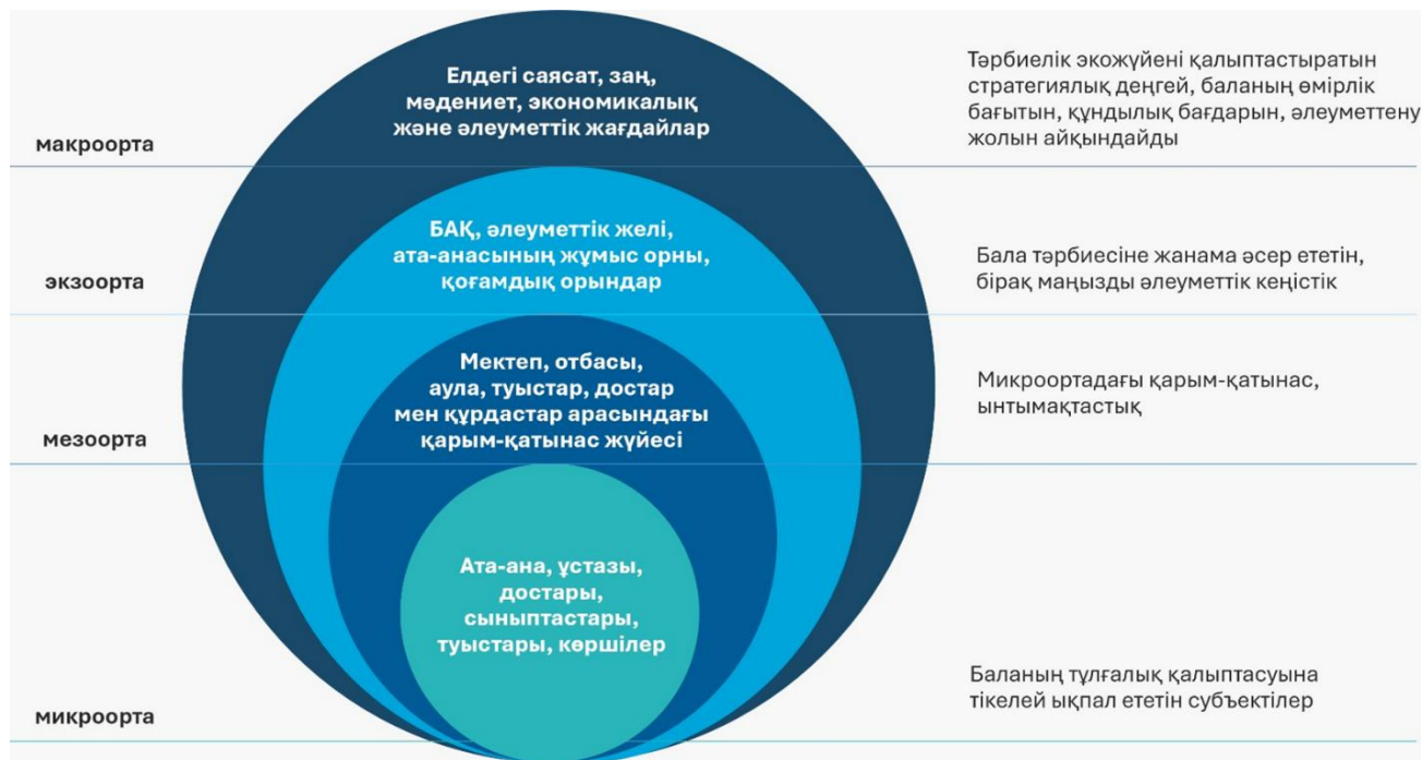
1-сурет - Ури Бронфенбреннер бойынша тәрбие экожүйесі

Университеттер бұл экожүйелерде цифрлық трансформацияға бейімделу, білімді басқару және технологиялар трансферті орталықтары ретінде әрекет ету арқылы шешуші рөл атқарады [13]. Экожүйелік тәсілдеме инновациялар мен бәсекеге қабілеттілікке ықпал ететін дәстүрлі иерархиялық модельдерге қарағанда тиімдірек деп саналады (сурет 1) [14].